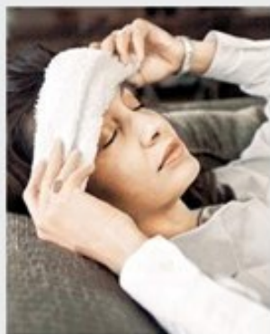
Положение пострадавшего: голова выше туловища

В этом случае, если у вас появилось подозрение не тепловой или солнечный удар, перенесите ребенка в прохладное затененное помещение и разденьте его. Можно обмахивать ребенка, чтобы создать прохладу.